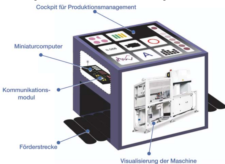
Bild 1 zeigt den prinzipiellen Aufbau eines Demonstrators. Gemäß den genannten Produktionsobjekten werden fünf Typen von Demonstratoren eingesetzt.

trachtet. Der Fokus liegt hauptsächlich auf dem Einsatz als Steuerungskonzept. Das Konzept der Digitalen Fabrik sieht physische Systeme der im Einsatz befindlichen Produktionsanlagen nur als zu steuernde Objekte und Datenlieferanten vor. Eine Simulation erfolgt nur an digitalen Modellen. Die Bewertung von alternativen technischen Realisierungen gestaltet sich konzeptbedingt schwierig, da diese entweder an den realen Anlagen installiert werden müssen oder ein zugehöriges Software-Modell erstellt werden muss, welches sich häufig als sehr aufwendig erweist. Die Modellierung der Digitalen Fabrik ist mit hohem Zeit- und Kostenaufwand verbunden. Insbesondere mittelständische Unternehmen verzichten deshalb trotz sinkender IT-Kosten auf die Nutzung dieses Planungsansatzes. Eine Modellfabrik ist eine vereinfachte Darstellung einer realen Fabrik. Ein geplantes oder ein real existierendes Originalsystem wird mit seinen Prozessen vereinfacht als Modell nachgebildet. Für den Begriff Modellfabrik existiert keine einheitliche oder allgemeingültige Definition. Hauptliches Manko ist die geringe Flexibilität. Zwar können durch den komponentenartigen Aufbau unterschiedliche Szenarien abgebildet und untersucht werden, jedoch bleibt das Gesamtszenario auf ähnliche Varianten beschränkt. Durch die Starrheit von Modellfabriken gestalten sich Untersuchungen von Alternativszenarien mit neuen Ideen und Konzepten schwierig und verhindern die Anwendung des Modells für anders geartete Abläufe.